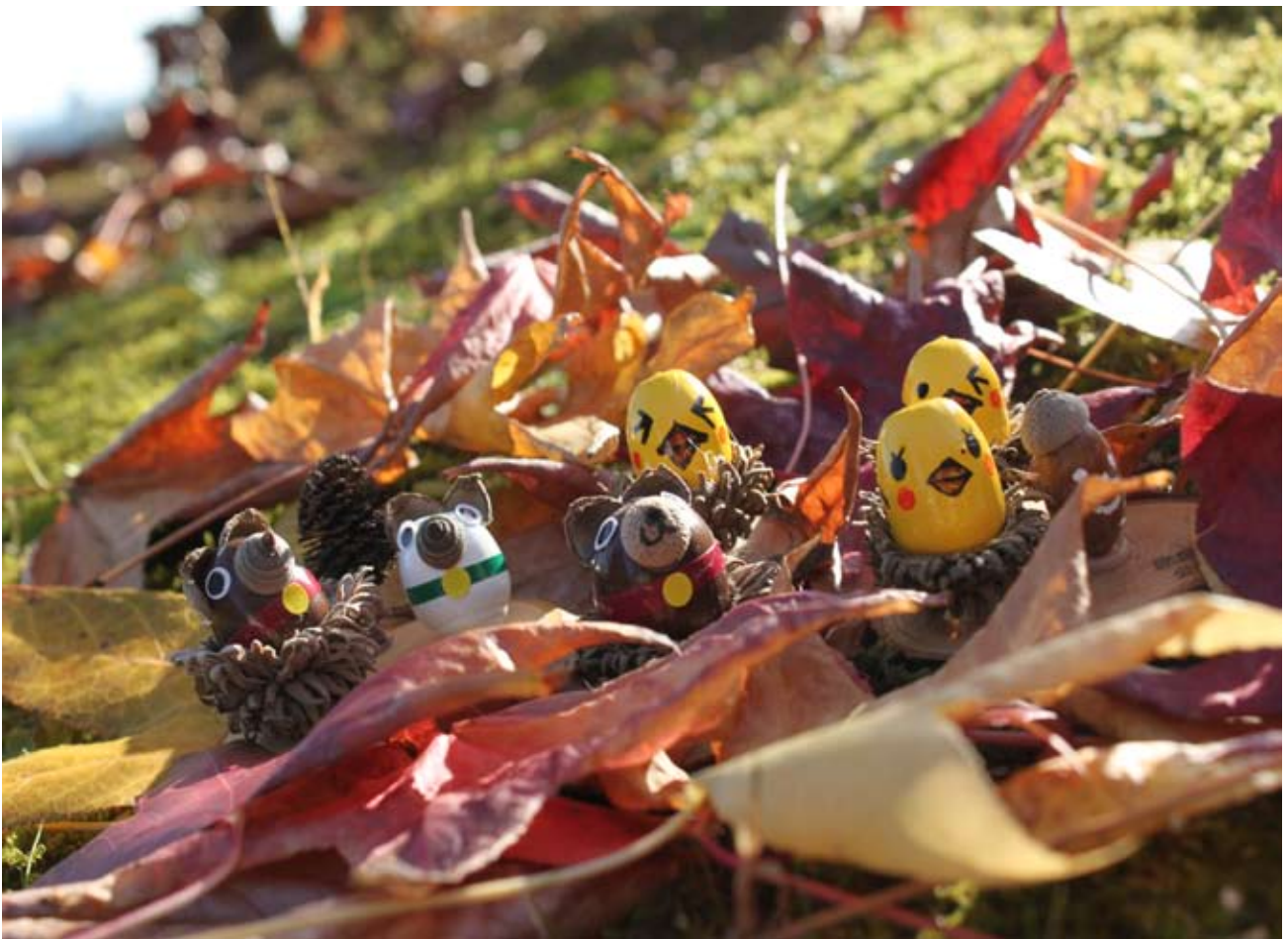
どんぐり干支のバトンタッチ